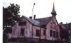
Menighetshuset før restaurering.

Lademoens menighetshus blir bydelshus. Det er inngått en avtale med kommunen om å stille huset til disposisjon som bydelshus om ettermiddagen. Et andelslag skal stå for driften.