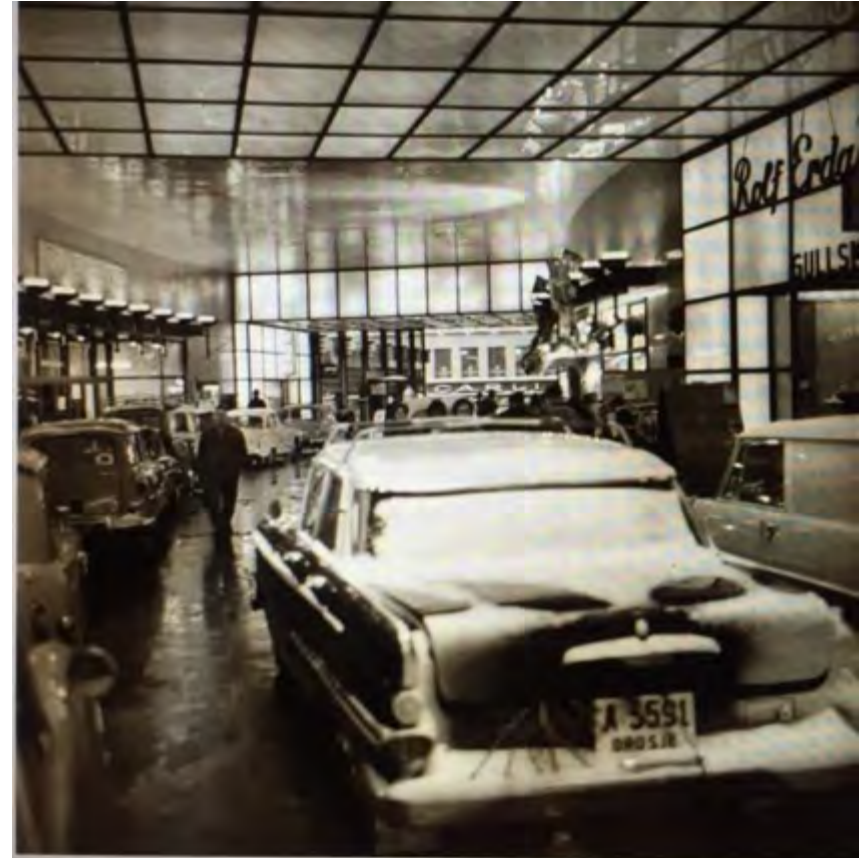
Folketeaterpassasjen i 1962