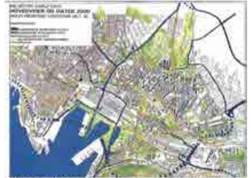
Nå har Oslo fått et nytt byutviklingsplan som viser hvordan byen skal utvikles fram til år 2000.