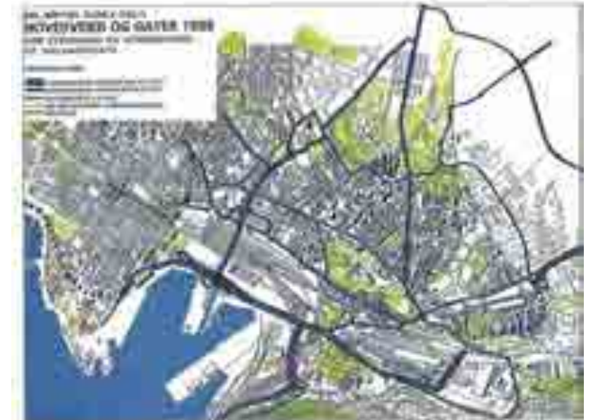
Først oppryddingstiltak - så visjoner for ny byutvikling