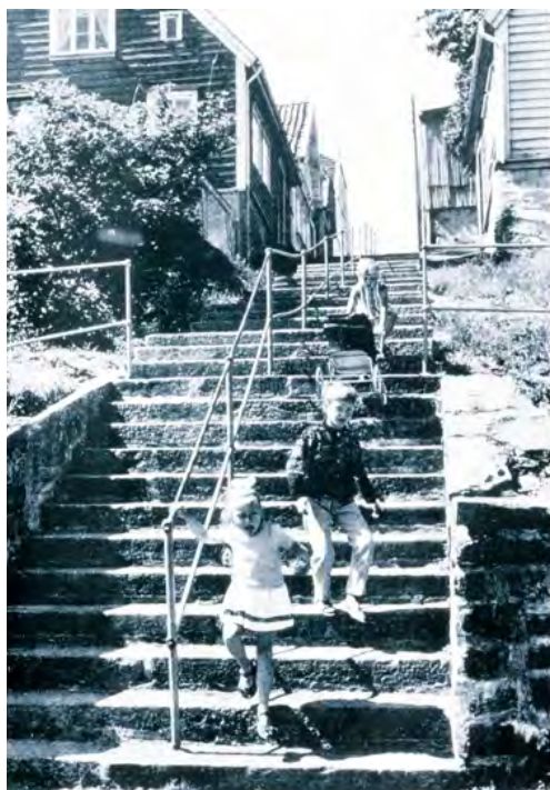
Fra Gamle Stavanger. Faksimile.

perioden for vekst i primærnæringene, derav følgende vekst i handelsvirksomhet på landsbygda, desentralisert industrialisering og ikke minst nye offentlige utdannings- og velferdsfunksjoner som bokstavelig talt fant sted i de nye tettstedene på landsbygda. I motsetning til «the turnaround trend» var dette fenomenet særnorsk.