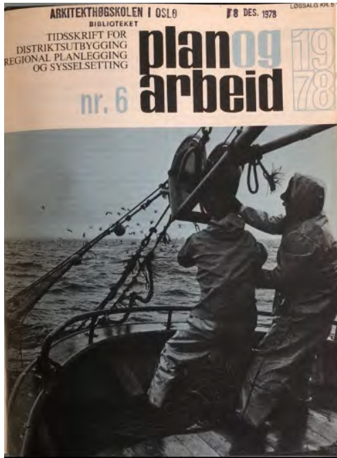
Plan og arbeid, tidsskrift for distriktsutbygging, regional planlegging og sysselsetting, forside, nr.6, 1978.

En annen kilde jeg har søkt for å teste hukommelsen min er tidsskriftet Plan. Faktaorientert og fri for den akademiske ambisiøsiteten som preger artikler som skal passe inn i det norske tellekantsystemet for forskningsartikler.