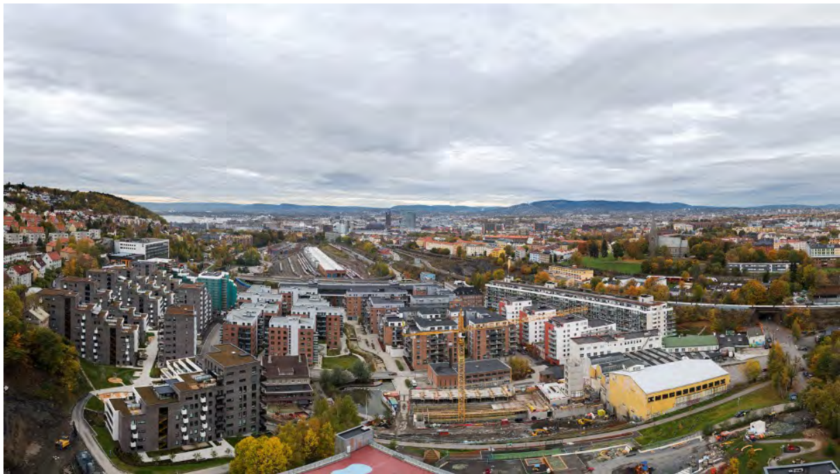
Lodalen i Oslo, ca. 2018

Fokus på transformasjon var ikke særegent for Norge, men gjaldt størstedelen av Europa. Det spesielle ved Norge var oljeøkonomien, høykonjunkturen som varte ved og den boligbaserte utbyggingsøkonomien som de fleste av oss har vært og er en del av. Å kjøpe en liten leilighet i Oslo har vært og er fortsatt, sjøl etter rentehevingen i går, den investeringen i Norge som kaster mest av seg.