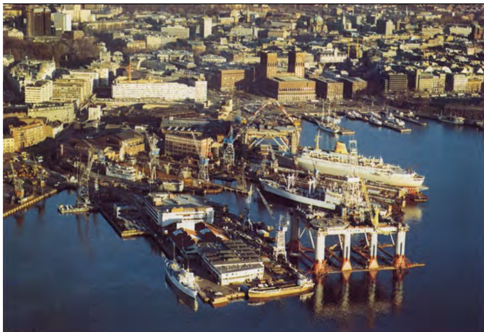
Akers mekaniske verksted, Oslo, 1960-åra.

Digitaliseringen – ny teknologi – skaper nye forutsetninger og gradvis omdanner samfunnet. Digitalisering gjør globalisering mulig, relokaliserer produksjon og etablerer globale produksjonsskjeder. Dette skjer innenfor rammen av nyliberal politikk , som avskaffelsen av den sosiale boligpolitikken fra midt på 1970-tallet og framover var det første tydelige norske eksemplet på.