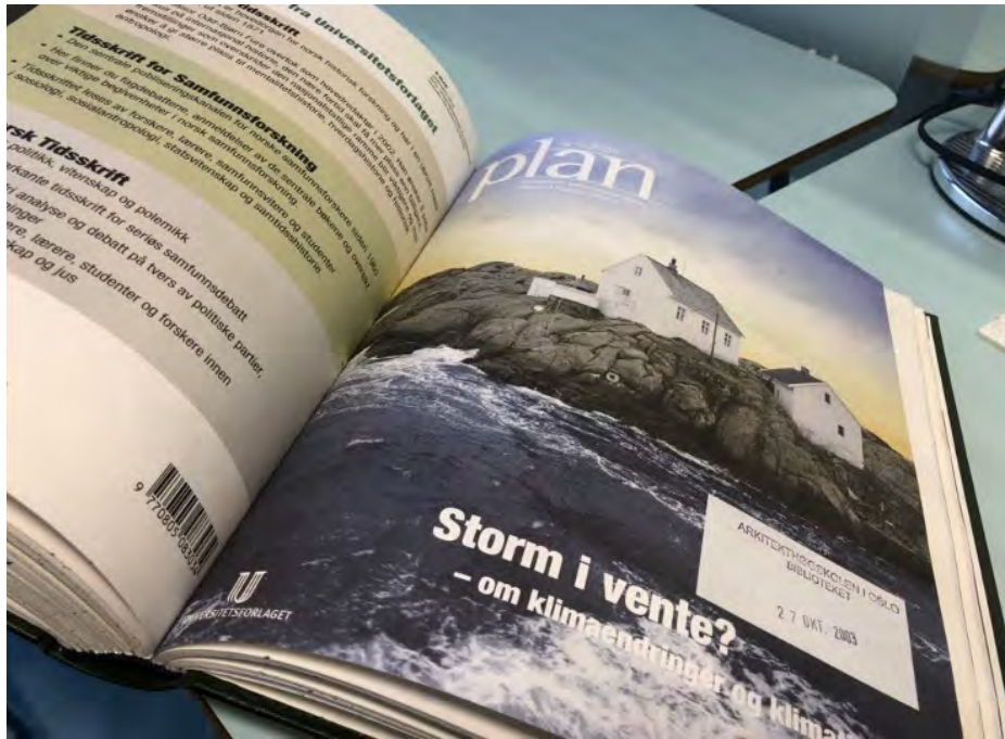
Storm i vente? Forside, Plan, 2003, 5.

Likevel kan det være på sin plass å problematisere både planlegginga, og det som er oppnådd i perioden. Er byutvikling i denne perioden reelt sett trinn på vegen mot bærekraftig byutvikling, eller kan planlegging i denne perioden mer presist beskrives som bidrag til en utviklingsprosess mot den gentrifiserte byen? Det siste er etter min oppfatning utvilsomt riktig. Det første er mer diskutabelt.