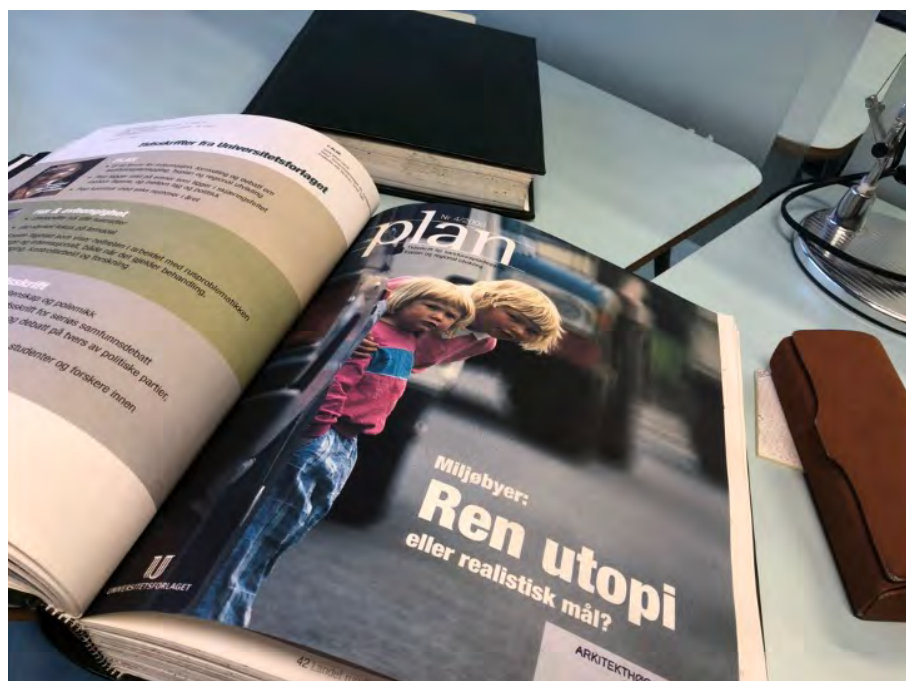
Plan, forside, 2000, nr.4